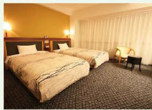
コンフォートツイン